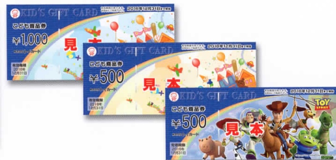
アーチ部分が紺色の「こども商品券」4券種