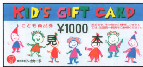
旧こども商品券 1000円券