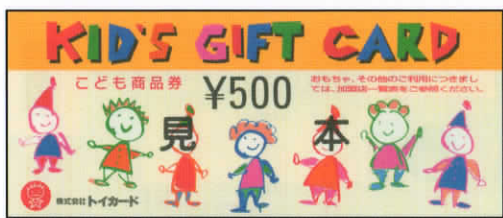
旧こども商品券 500円券